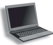
Nagroda dla małej szkoły