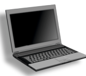
Nagroda dla małej szkoły